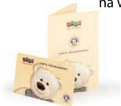
BON ZAKUPOWY - SKLEP "SMYK"