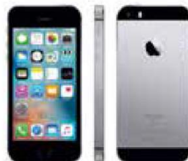
IPHONE SE 32GB SPACE GREY