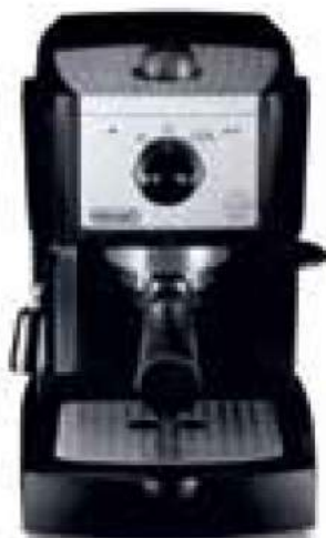
CIŚNIENIOWY EXPRES DO KAWY MARKI - DE LONG